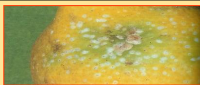
Cocciniglia bianca del limone

In presenza di focolai di ragnetto ( Tetranychus urticae ), si consiglia di intervenire con olio bianco (300 gr per ql di acqua) attivato con un acaricida ovo-larvicida e un acaricida larva-adulticida, di quelli sopra menzionati.