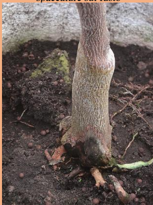
Marciume al colletto

Cancro gommoso ( Phomopsis citri e Dothiorella gommosi )