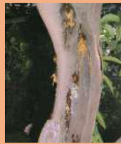
Flussi gommosi su vecchio tronco di limone