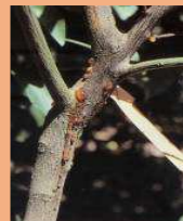
Marciume da Phytophthora sul nido di giovane piantina in vivaio, fuoriuscita di flussi gommosi in prossimità del colletto e lesioni delimitate da cerchi cicatriziali e spaccature sul fusto