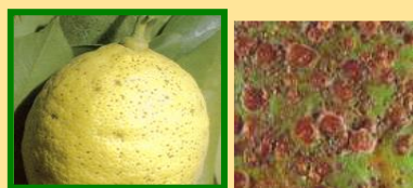
Cocciniglia rosso forte

Per chi aderisce alla Produzione Integrta Obbligatoria oltre a usare i prodotti di cui sopra, può usare anche gli altri che sono registrati sul limone e per questa malattia, rispettando i limiti di legge ( Sulfoxaflor, Flupyradifurone puro e altri ) . Si consiglia di effettuare il trattamento di sera, in modo da andare incontro alla riduzione delle temperature notturne!