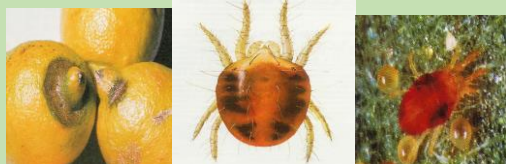
Ragnetto rosso ( Tetranychus urticae )

Consorzio di Tutela e Valorizzazione del Limone di Rocca Imperiale (CS)