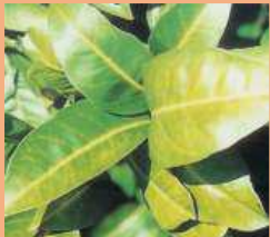
Nervatura clorotica da marciume radicale