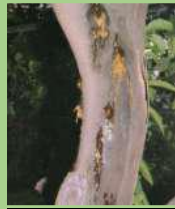
Flussi gommosi su vecchio tronco di limone