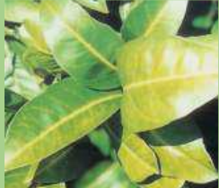
Nervatura clorotica da marciume radicale