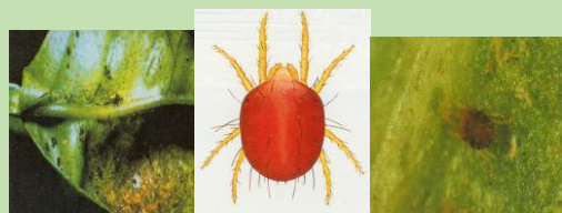
Ragno Rosso ( Panonychus citri )