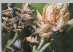
Danni di Prays citri sui fiori e sui frutticini