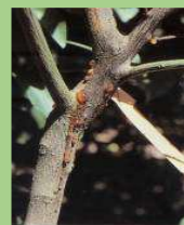
Marciume da Phytophthora sul nastro di giovane piantina in vivaio, fuoriuscita di flussi gommosi in prossimità del colletto e lesioni delimitate da cerchi cicatriziali e spaccature sul fusto