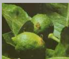
Su frutto in ingrossamento fuoriuscita di gomma sul punto di erosione della larvetta di tignola