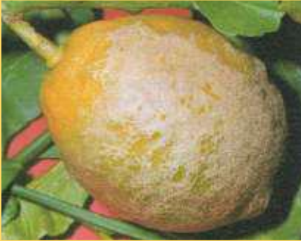
Rugginosità da tripide sul frutto