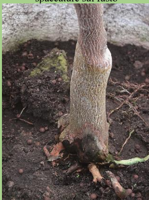
Marciume al colletto