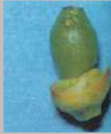
Danni di Prays citri sui fiori e sui frutticini