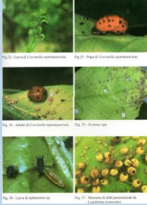
Forme di parassitizzazione di afidi