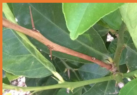
Mal secco ( Phoma tracheiphila )

In presenza di focolai di ragnetto ( Tetranychus urticae ), si consiglia di intervenire con olio bianco (1 kg per ql di acqua) attivato con un acaricida ovo-larvicida e un acaricida larva-adulticida, di quelli sopra menzionati.