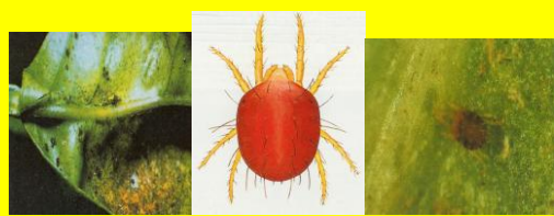
Ragno Rosso ( Panonychus citri )