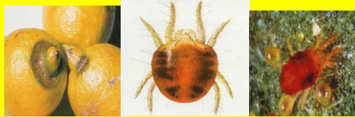
Ragnetto rosso ( Tetranychus urticae )

Consorzio di Tutela e Valorizzazione del Limone di Rocca Imperiale (CS)