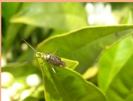
Adulto di Cimicetta su foglie

E' importante ricordare che durante la piena fioritura, salvo casi eccezionali, è sempre buona norma, evitare di fare trattamenti. Principi attivi poco selettivi danneggiano gli insetti pronubi utili durante l'impollinazione. Se è proprio necessario, conviene anticipare l'intervento a prima dell'apertura dei fiori e con prodotti selettivi e rispettosi degli insetti utili, ricordando che la presenza di arnie ed alveari facilitano l'impollinazione. Controllare anche le infestanti o i bordi che ospitano gli afidi (es. liquirizia, canne palustre)