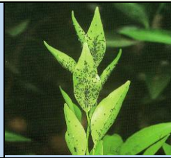
germogli infettati da afidi