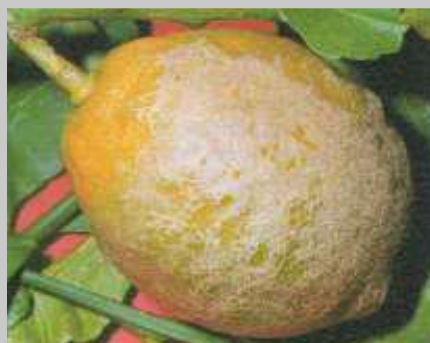
Rugginosità da tripide sul frutto