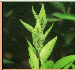
germogli infettati da afidi