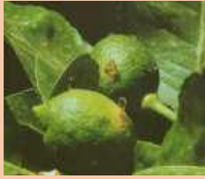
Su frutto in ingrossamento fuoriuscita di gomma sul punto di erosione della larvetta di tignola