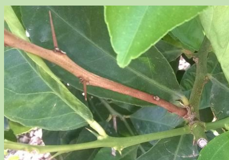
Mal secco ( Phoma tracheiphila )

In presenza di focolai di ragnetto ( Tetranychus urticae ), si consiglia di intervenire con olio bianco (1 kg per ql di acqua) attivato con un acaricida ovo-larvicida e un acaricida larva-adulticida, di quelli sopra menzionati.