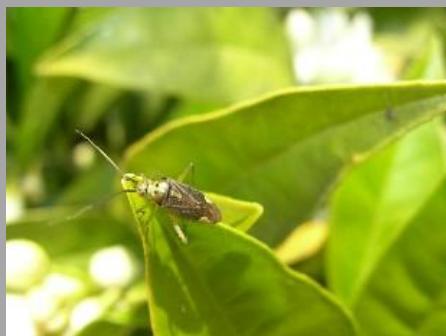
Adulto di Cimicetta su foglie

E' importante ricordare che durante la piena fioritura, salvo casi eccezionali, è sempre buona norma, evitare di fare trattamenti. Principi attivi poco selettivi danneggiano gli insetti pronubi utili durante l'impollinazione. Se è proprio necessario, conviene anticipare l'intervento a prima dell'apertura dei fiori e con prodotti selettivi e rispettosi degli insetti utili, ricordando che la presenza di arnie ed alveari facilitano l'impollinazione. Controllare anche le infestanti o i bordi che ospitano gli afidi (es. liquirizia, canne palustre)