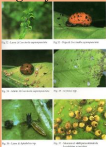
Forme di parassitizzazione di afidi