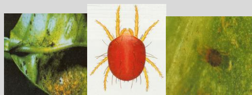
Ragno Rosso ( Panonychus citri )