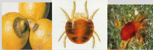
Ragnetto rosso ( Tetranychus urticae )

Consorzio di Tutela e Valorizzazione del Limone di Rocca Imperiale (CS)