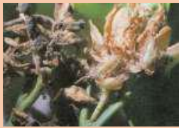
Danni di Prays citri sui fiori e sui frutticini