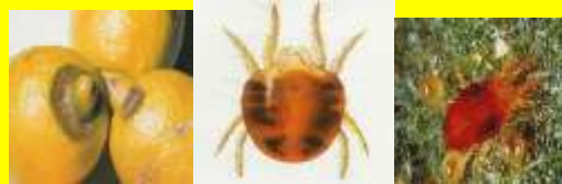
Ragnetto rosso ( Tetranychus urticae. )

Consorzio di Tutela e Valorizzazione del Limone di Rocca Imperiale (CS)