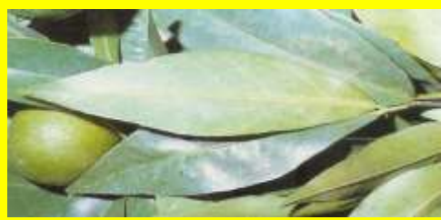
Ragno Rosso ( Panonychus citri )