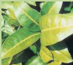
Nervatura clorotica da marciume radicale