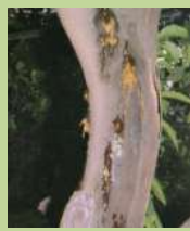
Flussi gommosi su vecchio tronco di limone