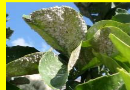
Aleirode fioccoso degli agrumi ( Aleurothrixus floccosus )

A superamento delle soglie di intervento.