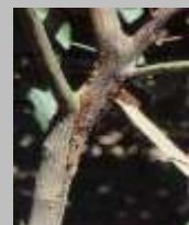
Marciume da Phytophthora sul nesto di giovane piantina in vivaio, fuoriuscita di flussi gommosi in prossimità del colletto e lesioni delimitate da cerchi cicatriziali e spaccature sul fusto