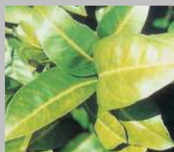
Nervatura clorotica da marciume radicale