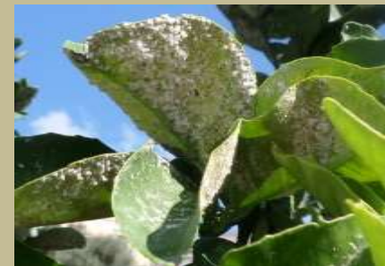
Aleirode fiocoso degli agrumi ( Aleurothrixus floccosus )

A superamento delle soglie di intervento.