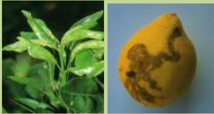
Minatrice Serpentina degli Agrumi ( Phyllonistis citrella )

Su giovani impianti e reinnesti, intervenire ogni 8-10 giorni a seconda della temperatura.