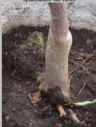
Marciume al colletto

Cancro gommoso (Phomopsis citri e Dothiorella gommosi)