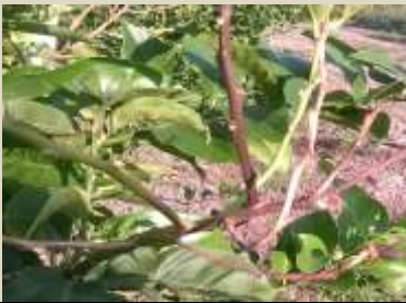
Mal secco ( Phoma tracheiphila )