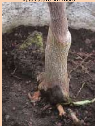
Marciume al colletto

Cancro gommoso ( Phomopsis citri e Dothiorella gommosi )