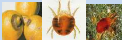
Ragnetto rosso ( Tetranychus urticae. )

Consorzio di Tutela e Valorizzazione del Limone di Rocca Imperiale (CS)