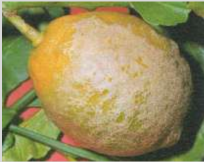
Rugginosità da tripide sul frutto