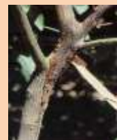
Marciume da Phytophthora sul nesso di giovane piantina in vivaio, fuoriuscita di flussi gommosi in prossimità del colletto e lesioni delimitate da cerchi cicatriziali e spaccature sul fusto