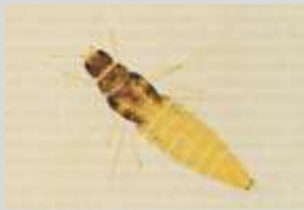
Femmina adulta di Heliothrips haemorrhoidales