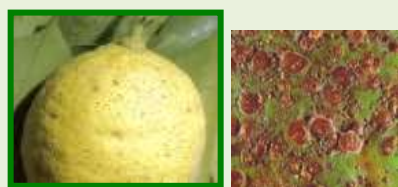
Cocciniglia rosso forte degli agrumi