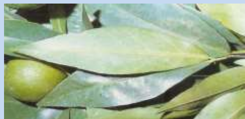
Ragno Rosso ( Panonychus citri )