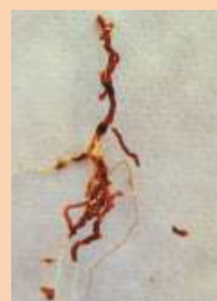
Radichette marce, prive di tratti del mantello corticale