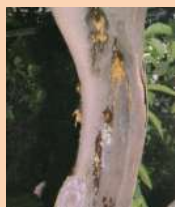
Flussi gommosi su vecchio tronco di limone