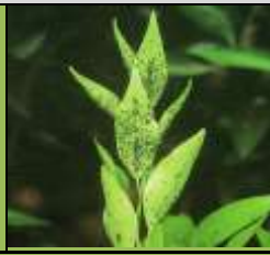
germogli infettati da afidi