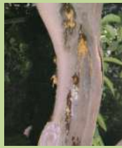
Flussi gommosi su vecchio tronco di limone