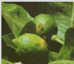
Su frutto in ingrossamento fuoriuscita di gomma sul punto di erosione della larveta di tignola