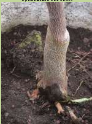
Marciume al colletto

Cancro gommoso (Phomopsis citri e Dothiorella gommosi)