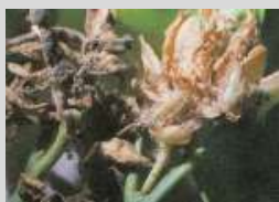
Danni di Prays citri sui fiori e sui frutticini

Considerata l'abbondante fioritura e il contenimento dei nemici naturali, non si giustifica un trattamento conto questo patogeno. Eventualmente, si giustifica un trattamento solo su impianti con scarsa fioritura e solo se si supera il 15% dei germogli recisi, tenendo comunque presente che prodotti non selettivi creano altri scompensi nell'equilibrio naturale.