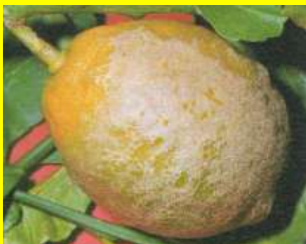
Rugginosità da tripide sul frutto