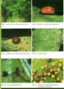
Forme di parassitizzazione di afidi