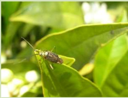
Adulto di Cimicetta su foglie