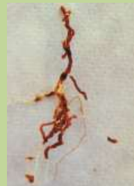
Radichette marce, prive di tratti del mantello corticale