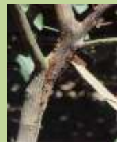
Marciume da Phytophthora sul nido di giovane piantina in vivaio, fuoriuscita di flussi gommosi in prossimità del colletto e lesioni delimitate da cerchi cicatriziali e spaccature sul fusto