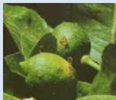
Su frutto in ingrossamento fuoriuscita di gomma sul punto di erosione della larvetta di tignola