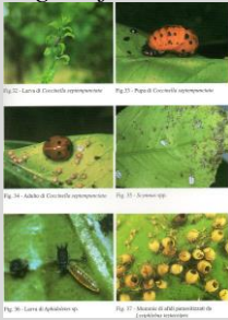
Forme di parassitizzazione di afidi