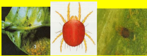
Ragno Rosso (Panonychus citri)