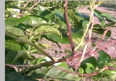
Mal secco (Phoma tracheiphila)