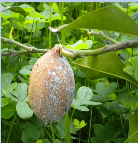
Allupatura ( Phytophthora spp )

Per chi aderisce alla Produzione Integrata obbligatoria oltre ai prodotti di cui sopra può utilizzare altri principi attivi registrati sul ragnetto e sul limone alle dosi riportate in etichetta.