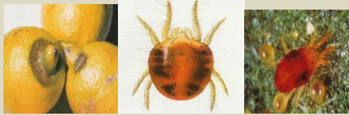
Ragnetto rosso ( Tetranychus urticae .)