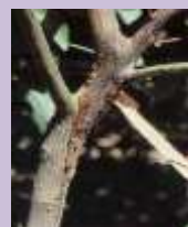
Marciume da Phytophthora sul nesso di giovane piantina in vivaio, fuoriuscita di flussi gommosi in prossimità del colletto e lesioni delimitate da cerchi cicatriziali e spaccature sul fusto