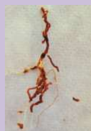
Radichette marce, prive di tratti del mantello corticale