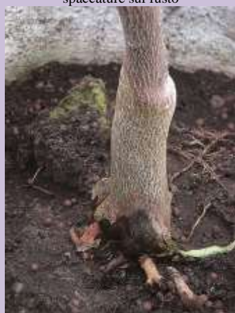
Marciume al colletto