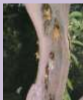
Flussi gommosi su vecchio tronco di limone