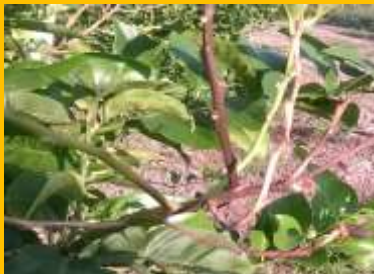
Mal secco ( Phoma tracheiphila )