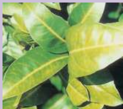
Nervatura clorotica da marciume radicale