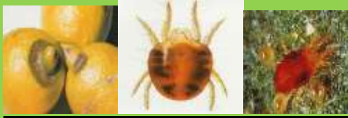
Ragnetto rosso ( Tetranychus urticae. )