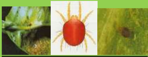
Ragno Rosso ( Panonychus citri )