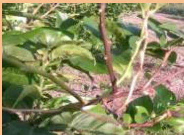
Mal secco (Phoma tracheiphila)