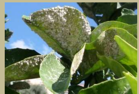
Aleirote fioccoso degli agrumi (Aleurothrixus floccosus)

A superamento delle soglie di intervento.