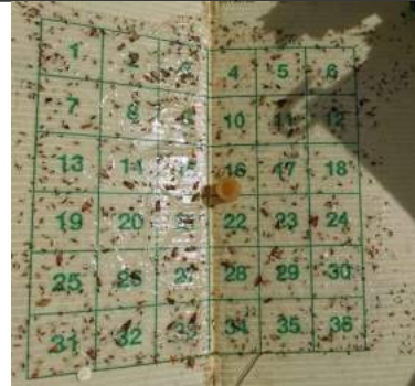
Trappola a feromoni sessuali di Lobesia botrana