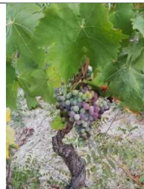
Gaglioppo – Caulonia