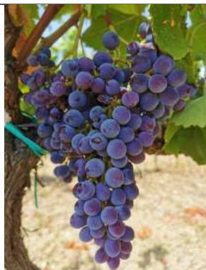
Gaglioppo – Riace

Le varietà monitorate si trovano in varie fasi a seconda della varietà e della posizione geografica la fase principale è di chiusura Grappolo (BBCH R79) con inizio invaiatura per le varietà su Caulonia-Riace (BBCH R81-R83).