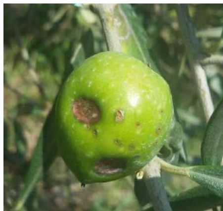
Drupa danneggiata, classico "taccone"