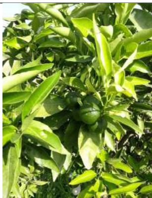
Clementine – Caulonia

Nel limone, la fase è di ingrossamento frutti (BBCH 74) .