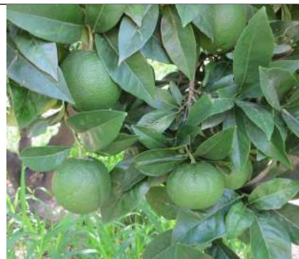
Navelina – Stilo