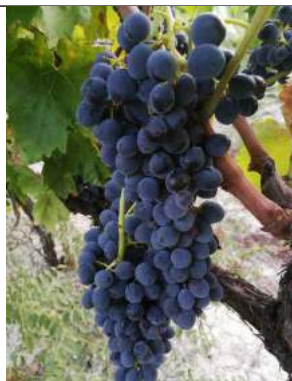
Calabrese – Caulonia