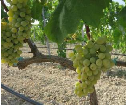
Inzolia – Stilo