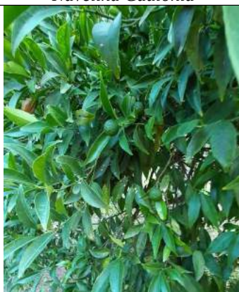
Tardivo di Ciaculli - Locri