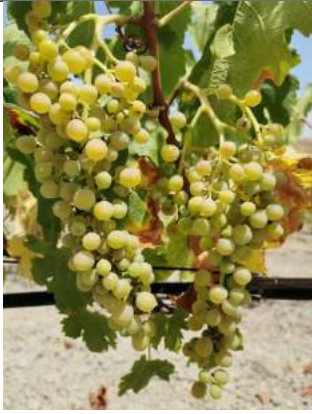
Greco Bianco – Riace