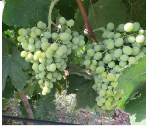
Greco Bianco – Stilo