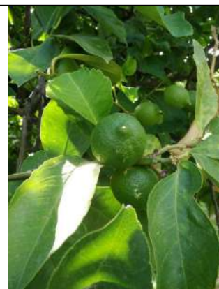
Limone Siracusano - Caulonia