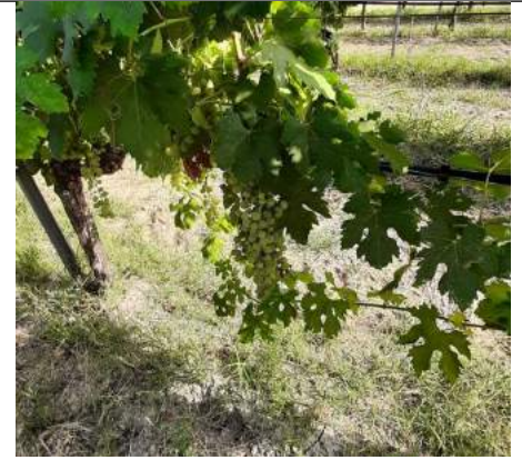
Greco Bianco – Casignana