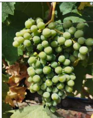
Gaglioppo – Riace

Le varietà monitorate si trovano in varie fasi a seconda della varietà e della posizione geografica la fase principale è di chiusura grappolo (BBCH R79) con inizio invaiatura per la varietà Calabrese su Caulonia ( BBCH R81 ).