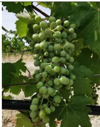
Greco Bianco – Riace