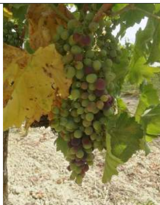
Calabrese – Caulonia