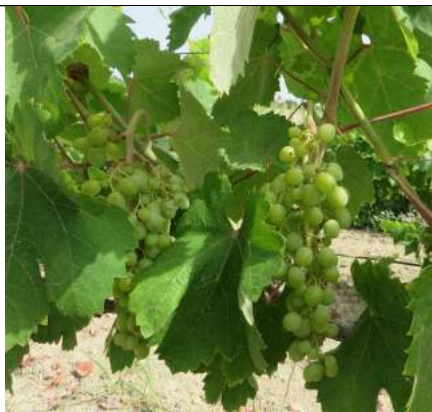
Greco Bianco – Stilo