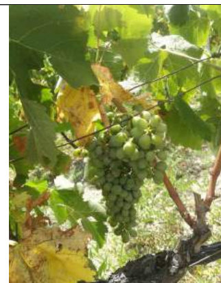
Gaglioppo – Caulonia