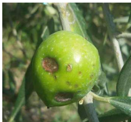
Drupa danneggiata, classico "taccone"

Tripide olivo ( Liothrips oleae ). Negli areali dove si sono verificati, nella scorsa annata, attacchi significativi di tripide dell'olivo, al fine di rilevare la presenza del fitofago, si consiglia di eseguire il monitoraggio. Nel caso di superamento della soglia d'intervento, rappresentata dal 10% dei germogli attaccati, rivolgersi ai tecnici del Centro di Divulgazione Agricola di Locri (RC).