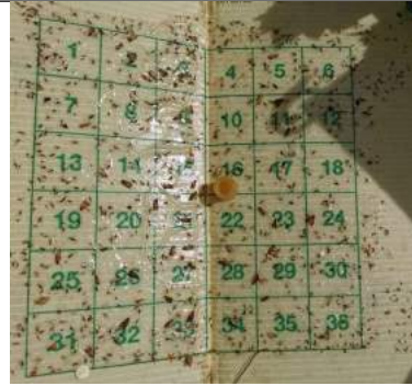
Trappola a feromoni sessuali di Lobesia botrana