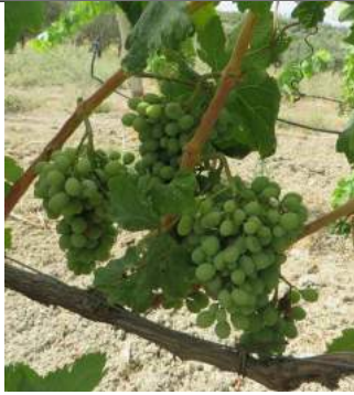
Inzolia – Stilo