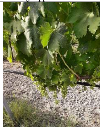
Greco Bianco – Casignana