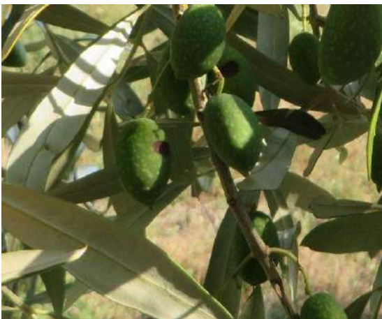
Olive deturpate da puntura di mosca ed infezione fungina

Mosca delle olive ( Bactrocera oleae ). Attualmente la l'attività di questo fitofago è ridotta. Siamo nella fase di indurimento nocciolo delle drupe (BBCH 75) si consiglia il posizionamento delle trappole per il monitoraggio della mosca dell'olivo ( Bactrocera oleae ), ciò ci permetterà di definire le strategie di difesa, al manifestarsi delle prime ovodeposizioni. Le alte temperature di questi giorni (superiori ai 30° C) stanno creando condizioni di sviluppo sfavorevoli alla mosca dell'olivo. Si evidenzia che i prodotti "imbiancanti" (caolino, calce), oltre all'azione repellente, sono utili per limitare gli effetti delle ondate di calore e a ridurre gli stress termici ed idrici per la vegetazione.