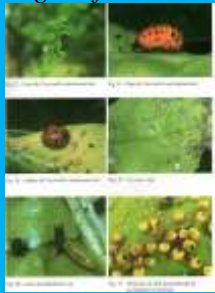
Forme di parassitizzazione di afidi