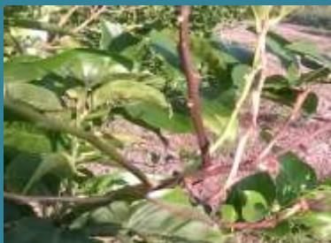
Mal secco ( Phoma tracheiphila )