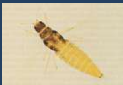
Femmina adulta di Heliothrips haemorrhoidales

E' consigliato disinfettare gli attrezzi (forbici, seghetto, ed altro) dopo i tagli di ogni singola pianta con prodotti a base di "ipoclorito di sodio".