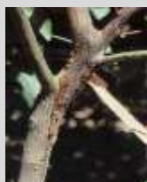
Marciume da Phytophthora sul nastro di giovane piantina in vivaio, fuoriuscita di flussi gommosi in prossimità del colletto e lesioni delimitate da cerchi cicatriziali e spaccature sul fusto