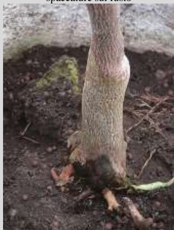
Marciume al colletto