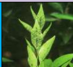
germogli infettati da afidi