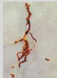
Radichette marce, prive di tratti del mantello corticale