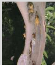
Flussi gommosi su vecchio tronco di limone