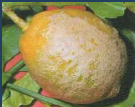
Rugginosità da tripide sul frutto