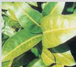
Nervatura clorotica da marciume radicale