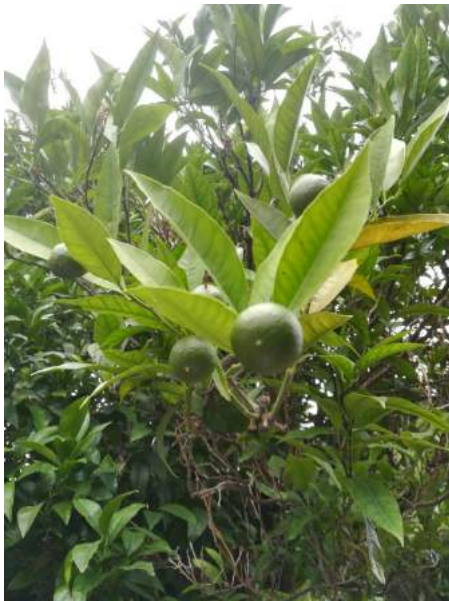
cv San Giuseppe

Nelle due varietà lo sviluppo dei germogli si è ormai arrestato; per quanto riguarda la fase riproduttiva, ambedue cultivar si trovano nella fase di ingrossamento dei frutti (fase BBCH 74). Il diametro dei frutticini è di 22/25 mm simile per le 2 cv.