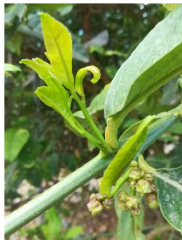
cv Liscio di Diamante