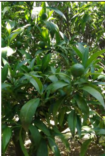
Clamentine - Caulonia