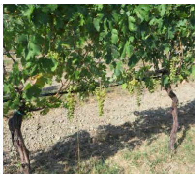
Greco Bianco - Casignana

Le varietà monitorate si trovano nella fase di chiusura grappolo -invaatura (BBCH: R79 – R81) , la maggior parte degli acini si toccano e le bacche virano di colore; le varietà Calabrese, Gaglioppo ed in alcuni casi, il Greco Bianco hanno raggiunto una colorazione degli acini quasi completa.