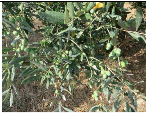
Grossa di Gerace - Locri