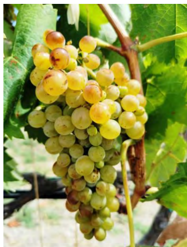
Greco Bianco - Riace