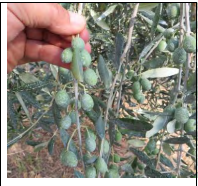
Frantoio - Locri