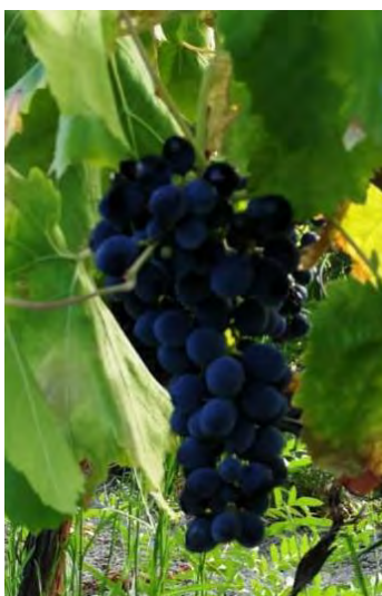
Calabrese - Caulonia