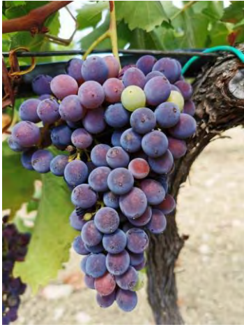
Gaglioppo – Riace