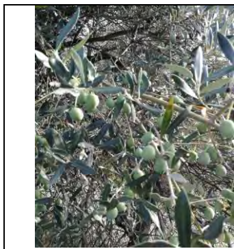
Grossa di Gerace - Caulonia

Le colture si trovano nella fase di ingrossamento frutti (BBCH 75) con completo indurimento nocciolo , le drupe hanno raggiunto e superato il 50 % delle dimensioni finali, in alcuni casi inizia il viraggio di colore dal verde cupo al verde chiaro-giallastro.