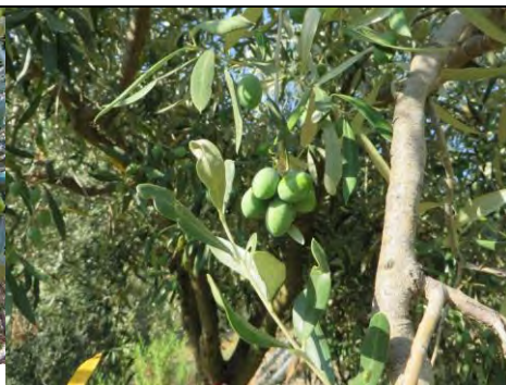
Nocellare - Stilo