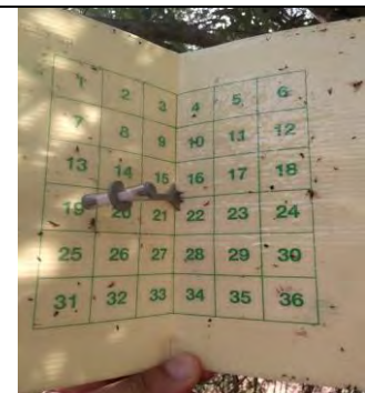
Trappola a feromoni sessuali con catture di Bactrocera Oleae , Stilo