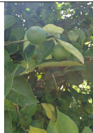
Limone Siracusano - Caulonia