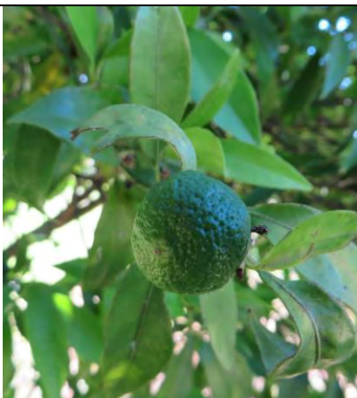
Mandarino Tardivo di Ciaculli - Locri

La situazione varia in base alla varietà: