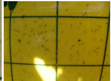
Trappola a feromoni sessuali con catture di Lobesia Botrana , Riace e trappola cromotropica con catture di Cicaline spp.