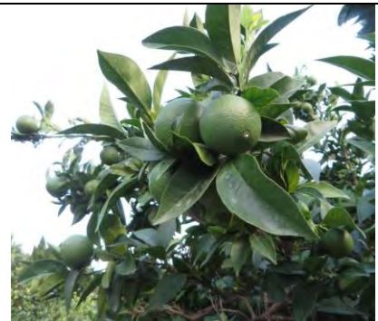
Navelina - Stilo