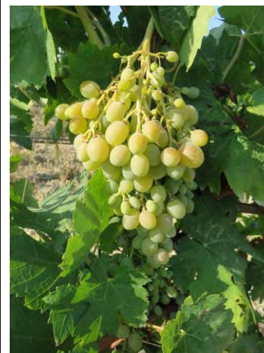
Inzolia – Stilo