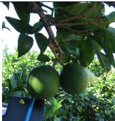
Navelina - Locri