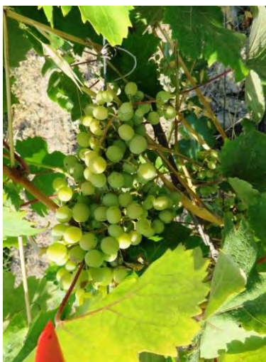
Greco Bianco - Stilo