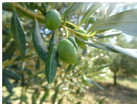
Ingrossamento frutto (indurimento nocciolo) (BBCH 75)