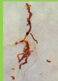
Radichette marce, prive di tratti del mantello corticale