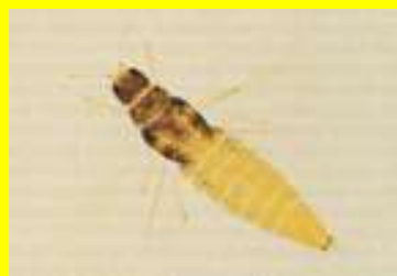
Femmina adulta di Heliothrips haemorrhoidales