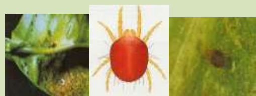
Ragno Rosso (Panonychus citri)