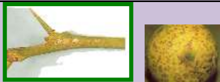
Cotonello (Planococcus citri)