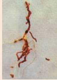
Radichette marce, prive di tratti del mantello corticale