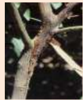
Marciume da Phytophthora sul nesto di giovane piantina in vivaio, fuoriuscita di flussi gommosi in prossimità del colletto e lesioni delimitati da cerchi cicatriziali e spaccature sul fusto