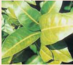
Nervatura clorotica da marciume radicale