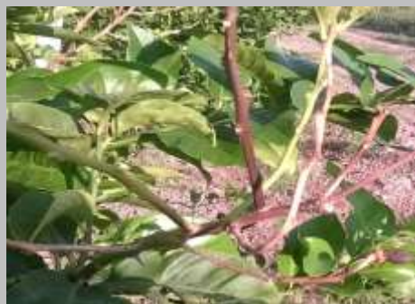
Mal secco ( Phoma tracheiphila )