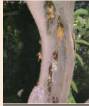
Flussi gommosi su vecchio tronco di limone