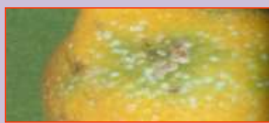
Cocciniglia bianca del limone

Per chi aderisce alla Produzione Integrata obbligatoria oltre ai prodotti di cui sopra può utilizzare altri principi attivi registrati sul ragnetto e sul limone alle dosi riportate in etichetta ( SPIRODICLOFEN ).